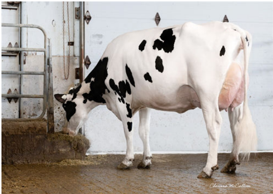
WALNUTLAWN LAMBDA BRIGHT DAM