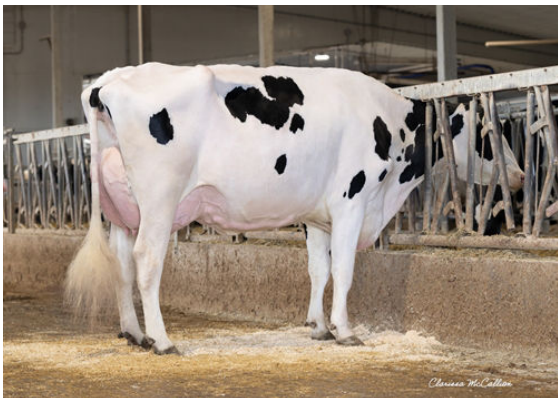
WALNUTLAWN LAMBDA BRIGHT DAM